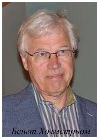
Бенгт Холмстрьом (1949 – )

Харт фокусира научните си изследвания върху разделението на властта в икономическите отношения, включително договорите. Той проучва ефектите, които подобни разделения на властта имат върху корпоративната структура и финансите. Колегата му Дейл Йоргенсон от Харвард казва през 1997 г., че работата на Харт „е довела до революция в сферата на корпоративните финанси“. Роденият във Великобритания, но гражданин на САЩ, Харт става бакалавър по математика в King's College към Университета в Кеймбридж през 1969 г., магистър по икономика в University of Warwick през 1972 г., а докторската си степен получава от Университета в Принстън през 1974 г. Той се присъединява към Харвард през 1993 г. и е ръководител на Факултета по икономика от 2000 до 2003 г.